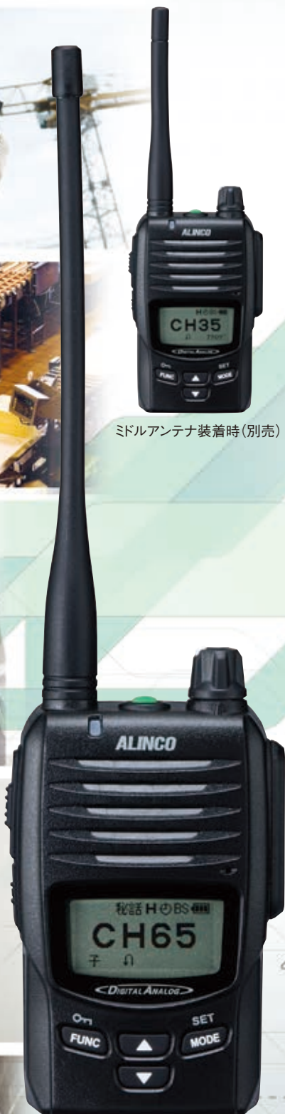
ミドルアンテナ装着時 (別売)